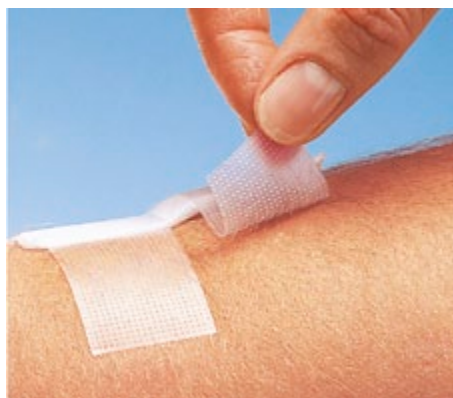
Omnifilm har häftmassan applicerad i strängar.

Huden måste vara torr vid fixering av tejp.