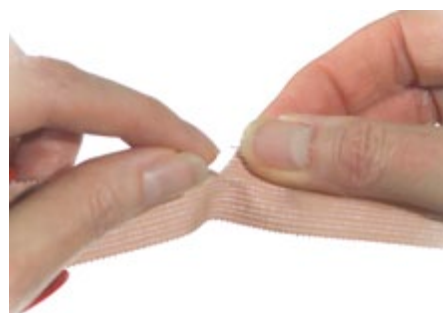
Så här river du Omniplast på rätt sätt.