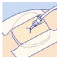
PermaFoam trakeostomi fungerar polstrande och uppsugande vid trakeostomi. Fixeras enklast med tejp t.ex. Omniplast.

Produkten är klassificerad som medicinteknisk produkt, klass IIb, steril. CE-märkt enligt EU-direktiv 93/42/EEC.