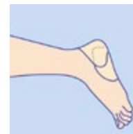
PermaFoam concave med häftkant för enkel fixering på häl och armbåge. Om häftkant inte kan användas fungerar det att använda en tillklippt standardplatta.