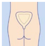
PermaFoam sacral används för sår i det sakrala området. Framför allt kraftigt vätskande trycksår. PermaFoam sacral har häftkant.